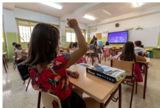
Grupo de niños en clase en el colegio público Federico de Arce de Murcia.

Crear una sociedad que de verdad tenga igualdad de oportunidades implica replantear algunos de los valores sociales dominantes, entender que no existe una sola definición objetiva de mérito y defender una acción decidida del Estado